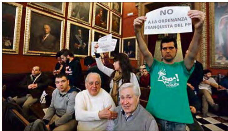
Los dos activistas del 15M protestando en el pleno. GUILLEM BOSCH

Dicho lo anterior se dirigió al alcalde: "Ahora, si quiere, me echa". Algo que Isern no hizo, sino que dio