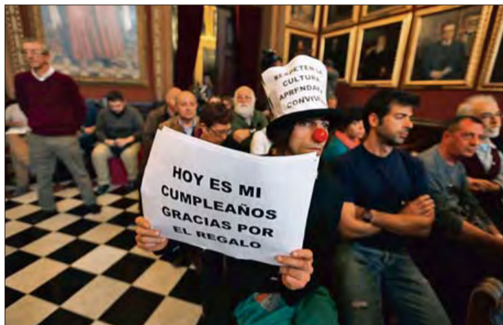
Un artista callejero protestando en el pleno por la ordenanza. GUILLEM BOSCH

Precisamente la persistencia de las cacas de los perros en las ace-