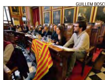
Los concejales de Més.

► Algo parecido pensaron los concejales de Més per Palma que, coincidiendo con la aprobación de la polémica ley de símbolos en el Parlament, decoraron sus escaños en Cort con un gran lazo reivindicativo del uso del catalán con la bandera cuatribarrada y con una miniatura de todos los lazos de colores que representan distintas causas.