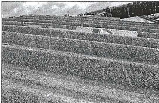
Imagen de una cubierta de fibrocemento reparada. ES PONT

Los funcionarios municipales con habilitación nacional como pueden ser el secretario o el interventor deberán acreditar el conocimiento de catalán para ocupar su plaza. El equipo de gobierno aceptó una proposición presentada en este sentido por el grupo municipal Més, aunque no se instará al Govern a cambiar la normativa al respecto, sino que se procederá a modificar la Relación de Puestos de Trabajo (RPT) e introducir como requisito y no como mérito el conocimiento por parte de estos funcionarios de catalán. Tanto la secretaria actual, como el adjunto y la interventora cumplen el requisito. J. C. PALMA