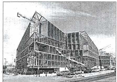
Las obras del Palacio de Congresos, paralizadas desde julio de 2012.

Desde Cort han manifestado en varias ocasiones que cuando la constructora cobre negociarán la reanudación de las obras; faltan 36,5 millones para terminarlas.