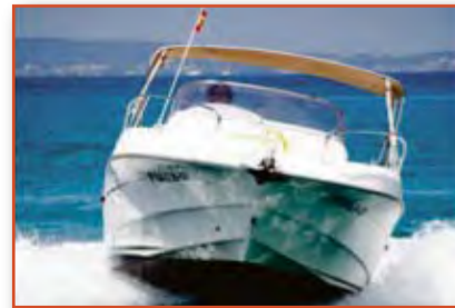
BENETEAU SUNDECK 750