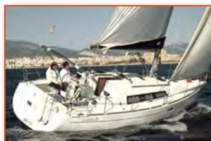
BENETEAU OCEANIS 31

1er turno: 10:00 - 12:00 2º turno: 12:00 - 15:00 • 3er turno: 15:00 - 18:00